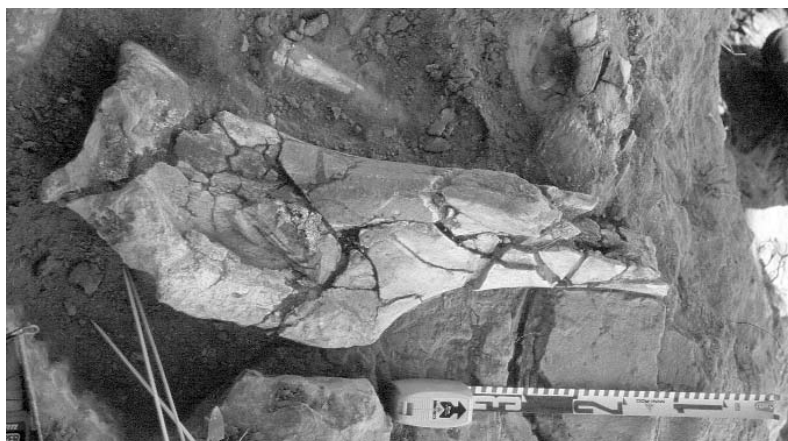
Figura 1. Fragmento distal de húmero de individuo infantil de Mammuthus meridionalis durante los trabajos de excavación paleontológica sistemática llevados a cabo durante 2002.

El húmero pertenece a un individuo inmaduro, el cual no había completado la fusión de sus epífisis en el momento de su muerte (Fig. 1). Este ejemplar se extrajo del yacimiento en dos grandes bloques, los cuales permanecen de momento en proceso de restauración, por lo que una descripción más detallada del fósil resulta actualmente imposible.