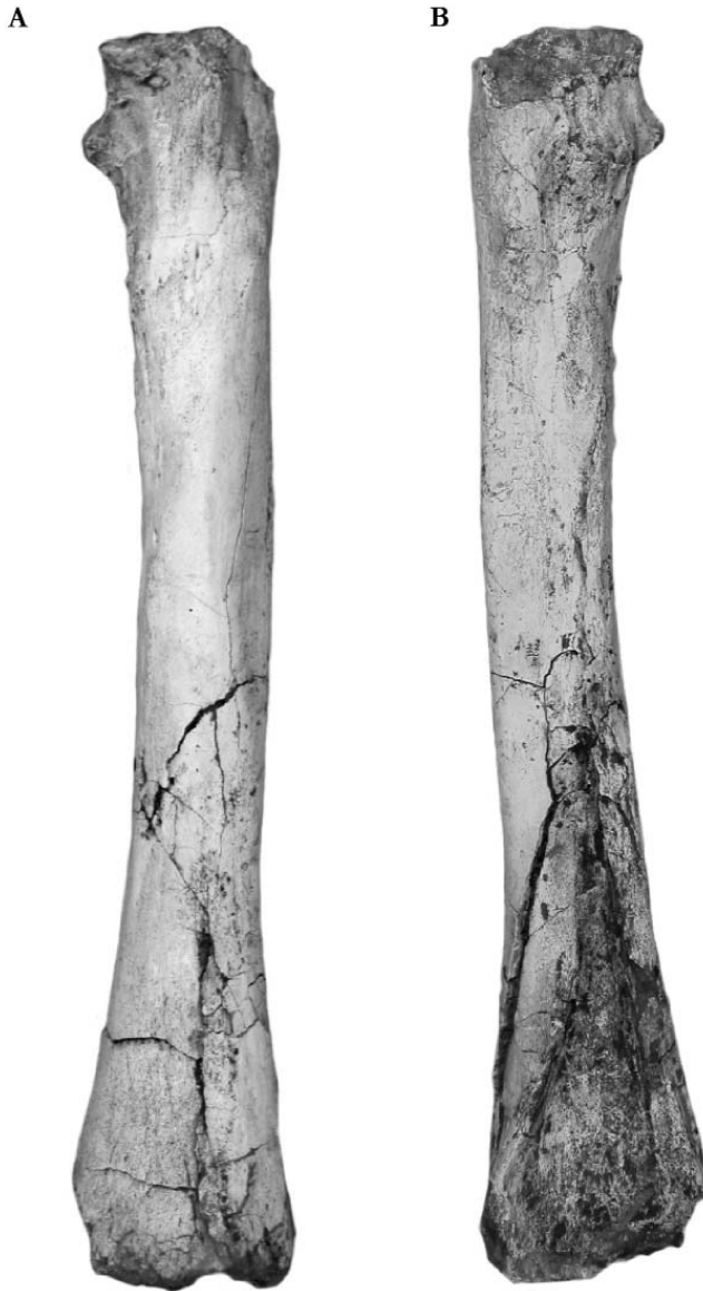
Figura 3. Fragmento diafisario de radio de un individuo infantil de Mammuthus meridionalis (FP1-2002-1111). A: vista dorsal; B: vista ventral. Escala gráfica: 5 cm.

El radio conserva únicamente la región diafisaria ya que, debido a la condición infantil del individuo, las epífisis no se encuentran fusionadas (Fig. 3; tabla 2). Esta diáfisis sigue un recorrido rectilíneo, con su extremo distal ensanchado. La cara dorsal muestra una fuerte convexidad recorrida por una gran cresta longitudinal de inserción muscular de contorno sinuoso (Fig. 3A), mientras la cara ventral es prácticamente plana (Fig. 3B).